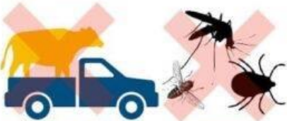
งดเคลื่อนย้ายสัตว์ป่วย