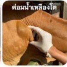
ต่อมน้ำเหลืองโต