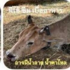
มีไข้ ซึม เบื่ออาหาร