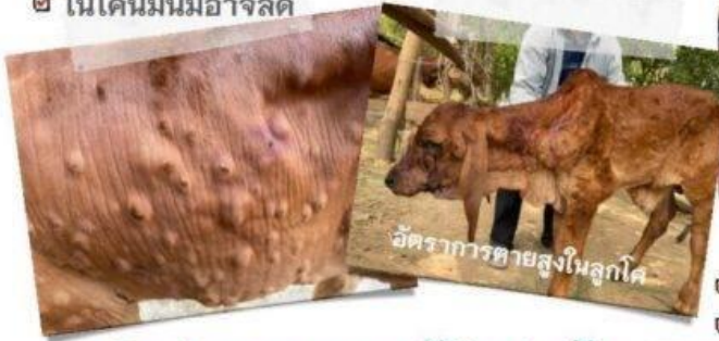
อัตราการตายสูงในลูกโค