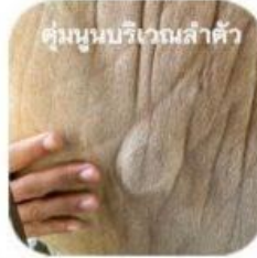
ตุ่มนูนบริเวณลำตัว