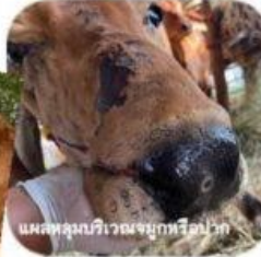
แผลหลุมบริเวณจมูกหรือปาก