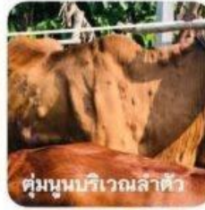
ตุ่มนูนบริเวณลำตัว